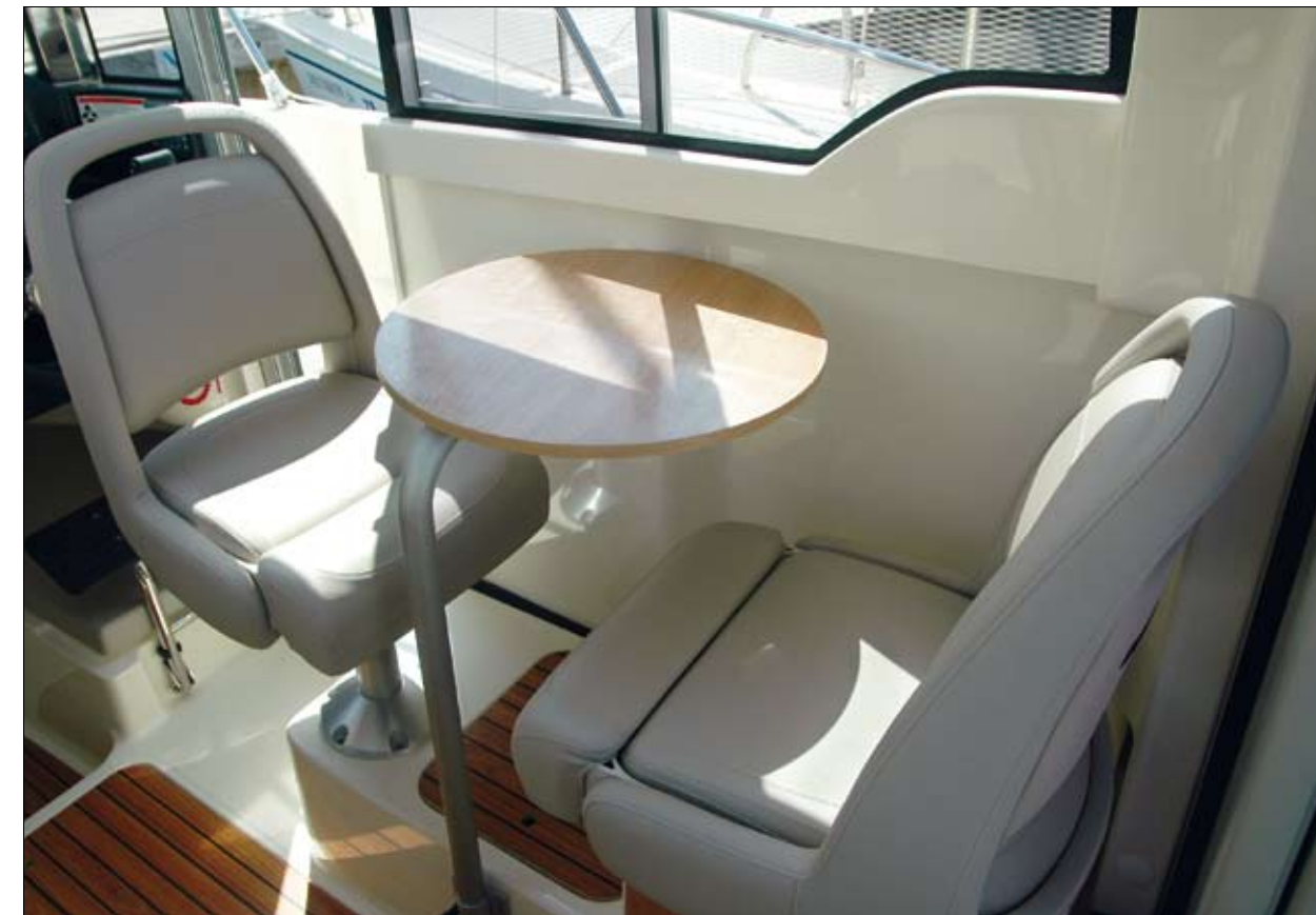
La mesa incluida en el pack Comfort permitirá crear una pequeña dinette en el interior de la timonera.