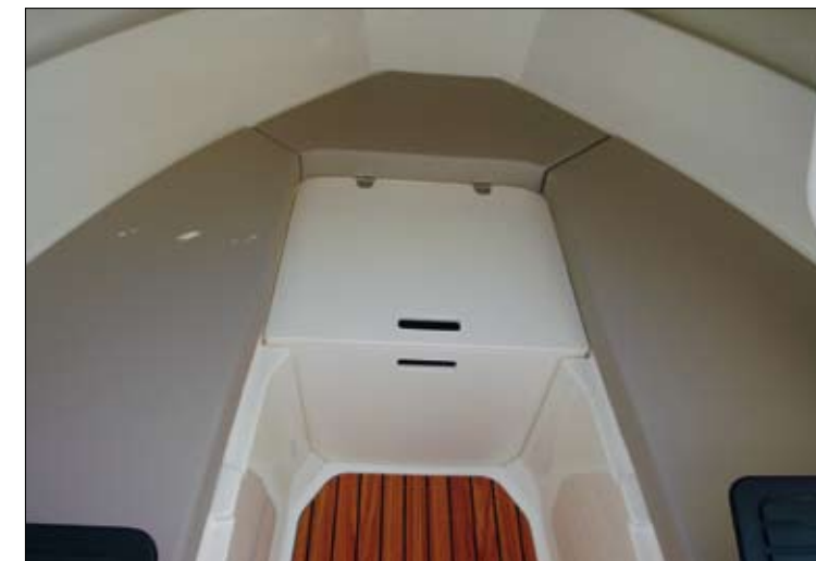
El asiento en V de la cabina se convierte, mediante varios apliques, en una enorme cama con capacidad para dos o tres personas.