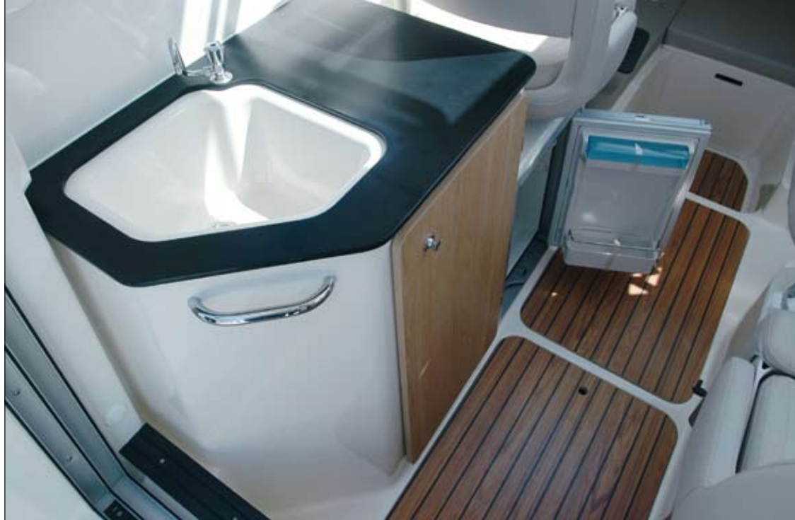
Una pequeña cocina, en babor, incorpora un fregadero moldeado y un armario que podrán acompañarse de una nevera.