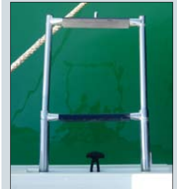
La escalera de baño telescópica queda perfectamente escamoteada en el interior de la estructura de la plataforma de baño.