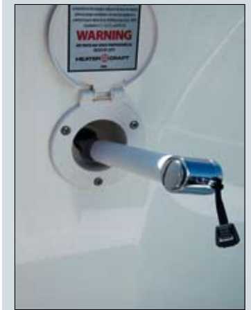
La ducha de popa, si se adquiere, queda instalada a estribor del acceso que comunica la plataforma de baño con la bañera.