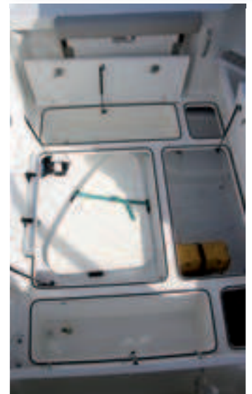
Todo el suelo de bañera se ocupa con múltiples tapas de cofres de estiba.