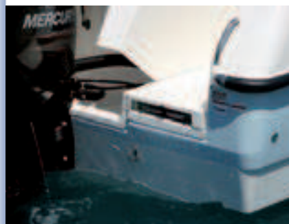
La escalera con tapa.