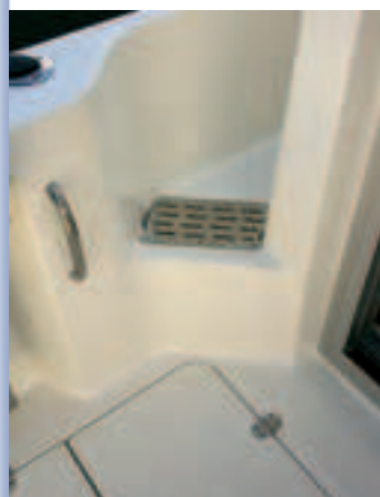
Las rejillas del desagüe.