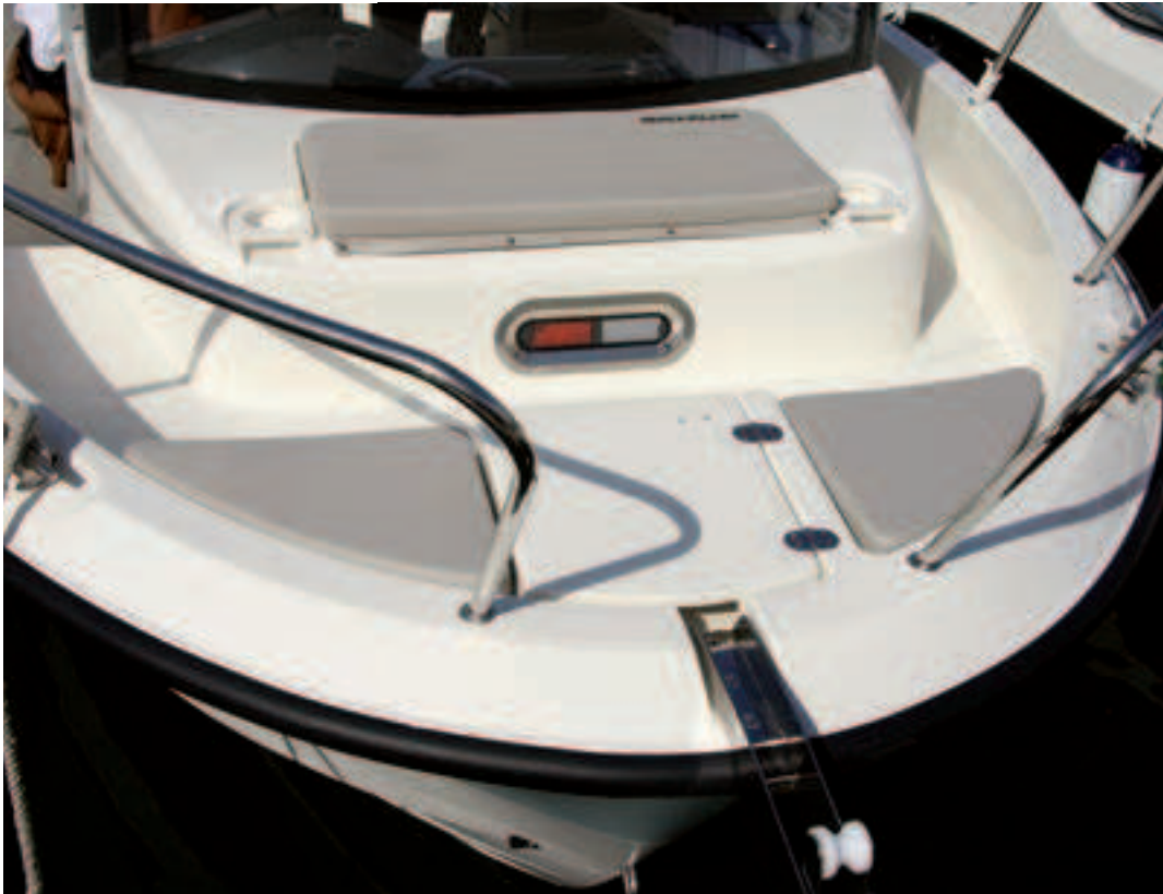
En proa la cubierta forma tres asientos con acolchado desmontable.