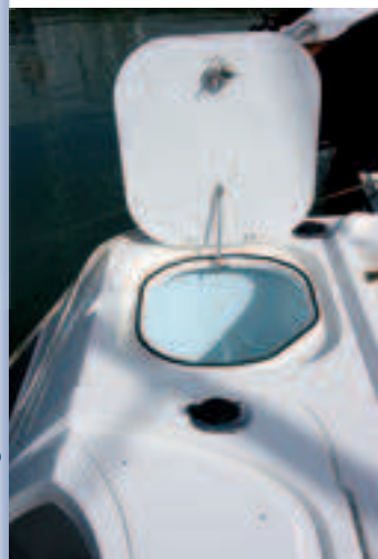
Su vivero de gran tamaño.