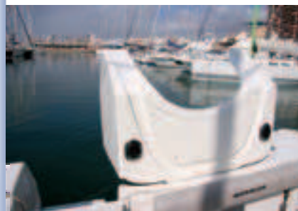
La tapa de acceso al motor.