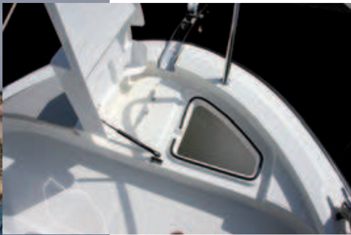
La tapa del cofre de anclas deja espacio para una cornamusa e incluso podría montar un molinete.