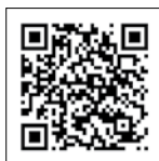
Vídeo Quicksilver Activ 595 Cabin (Nàutica Guixòls)

H ace ya cierto tiempo que la gama Activ ha mejorado notablemente, tanto en diseño como en pequeños detalles y accesorios que, aplicados por todo el barco, realzan el nivel de calidad general. Como tantos otros barcos fabricados en Polonia —hoy en día americanos, franceses, noruegos, italiano e incluso españoles— las Quicksilver han conseguido dominar el mercado en la mayoría de sus segmentos y la serie Activ es una de ellas. La 595