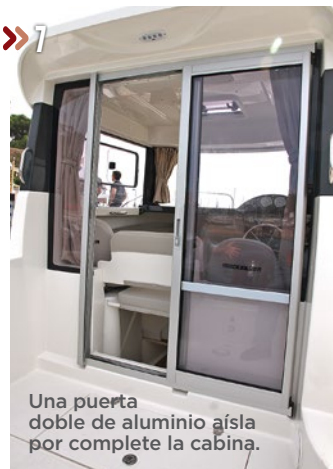
Una puerta doble de aluminio aísla por completo la cabina.