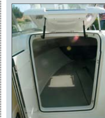
El sistema de apertura de la puerta de la cabina ofrece un confortable acceso a su interior.