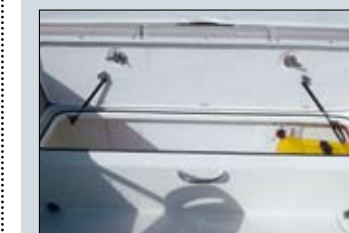
El asiento que cierra la bañera se aprovecha para ofrecer un volumen de almacenamiento de apertura asistida por dos pistones a gas.