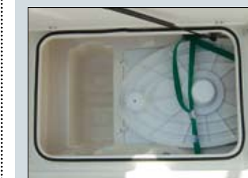
El suelo de la bañera incorpora un amplio cofre de estiba que permitirá sujetar convenientemente la mesa de la bañera.