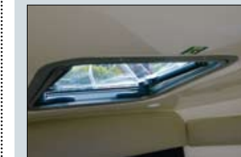
La escotilla practicable incluida en la cubierta de proa contribuye a proporcionar la luz y la ventilación necesarias al interior.