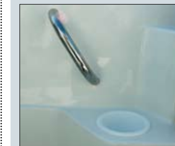
La situación estratégica de varias asas en acero inoxidable alrededor de la bañera incrementará la seguridad de la tripulación durante la navegación.