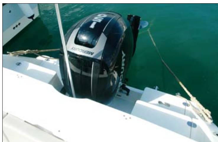
La configuración de la popa reserva el espacio suficiente para poder subir el motor.

La consola incluye una escalera moldeada en el centro que facilita el acceso a proa junto con la portezuela del parabrisas, DANDO PASO ASÍ A LA MANIOBRA DE FONDEO Y, DE FORMA OPCIONAL, AL SOLÁRIUM