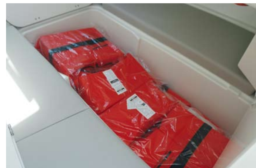
La sección central de la cama de la cabina se extrae para descubrir un práctico compartimento de estiba.