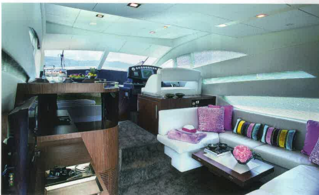
Ofrece en el salón central un volumen considerable bien aprovechado por el comedor.