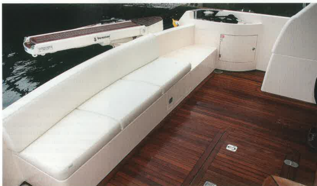
El largo asiento de popa oculta, opcionalmente, el camarote del marinero.

Los pasillos que rodean la cabina son anchos y cuentan con un pasamanos bien situado que,