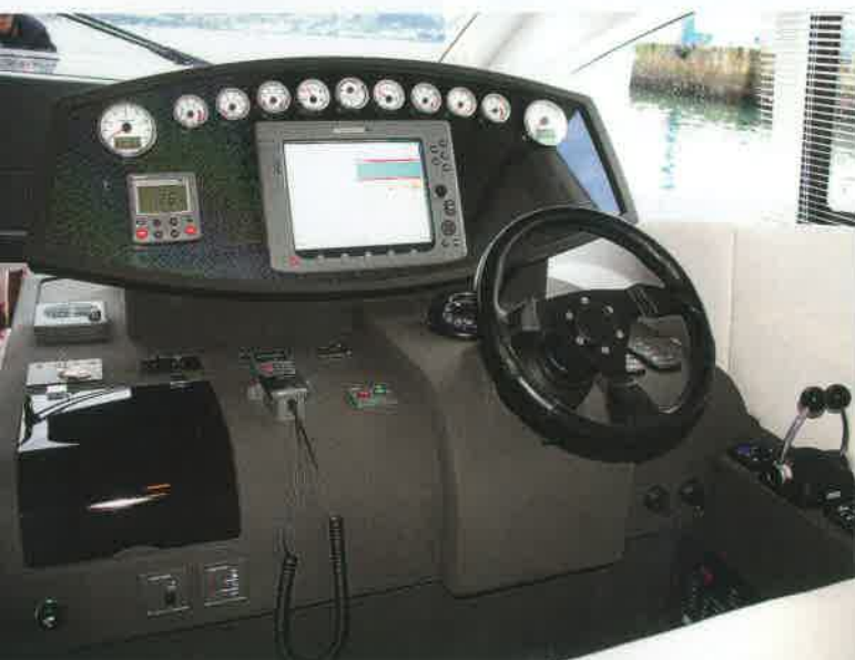
La consola de gobierno interior es bastante alta y con amplia capacidad.