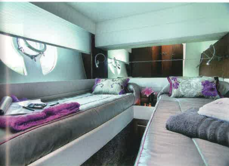
El camarote de estribor dispone de dos camas separadas y buena luminosidad.

modificaciones y que se compone de un asiento ancho y una consola de atractivo diseño con buena capacidad para electrónica. Este espacio se complementa con el gran solárium acolchado que ocupa una buena parte de la superficie del fly, quedando situado bajo el perfil interior del deflector delantero.