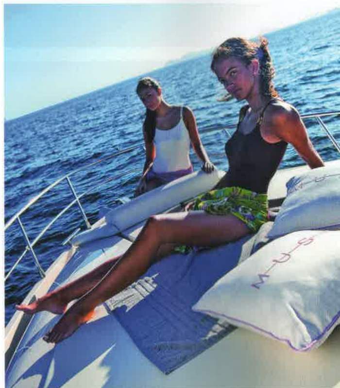
Sobre la cubierta de proa dispone de solárium acolchado y asiento de bajo respaldo.