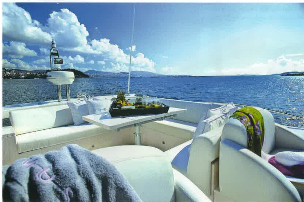
La dinette del fly ofrece una mesa de alas plegables y buena capacidad.

Una puerta tubular cierra, en estribor, el pasillo de entrada a una espaciosa bañera, donde lo pri-