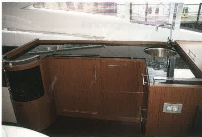
En la cocina, la encimera queda algo desplazada de la escotilla practicable.

equipamiento que incluye una escotilla algo alejada de la encimera. También destacaremos un original armario superior con dos bandejas giratorias en su interior, muy prácticas para acceder a toda la estiba.